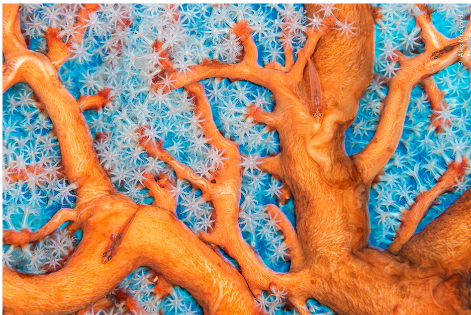
Connexions coralliennes de Alex Mustard, Royaume-Uni Sélectionné dans la catégorie Monde aquatique

A lex Mustard nous dévoile la biodiversité d'un récif corallien en bonne santé alors que des gobies se Aреpose dans les branches d'une gorgone.