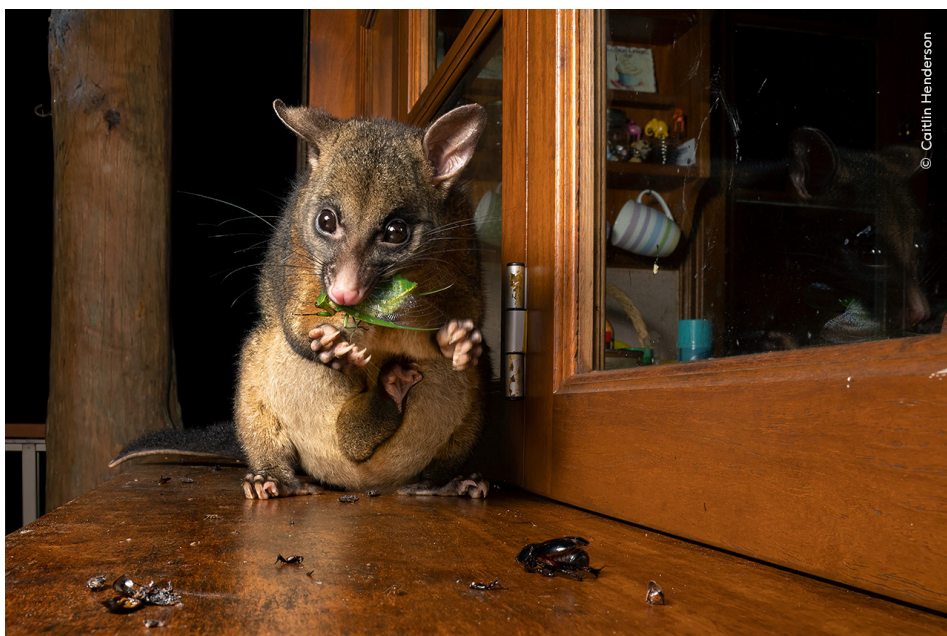
« Pause casse-croûte de mi-nuit » de Caitlin Henderson, Australie Sélectionné dans la catégorie Faune urbaine

Les récifs coralliens abritent une diversité d'espèces interconnectées, mais ils sont menacés par le réchauffement des mers dû au changement climatique.