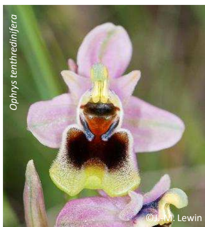
Ophrys tenthredinifera Ophrys guêpe