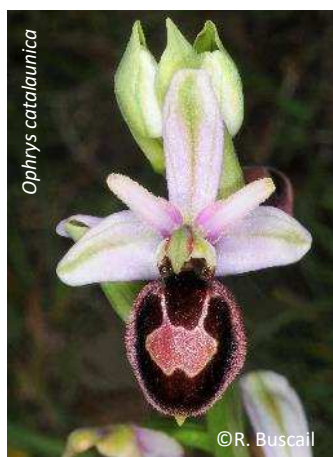
Ophrys catalaunica Ophrys de Catalogne