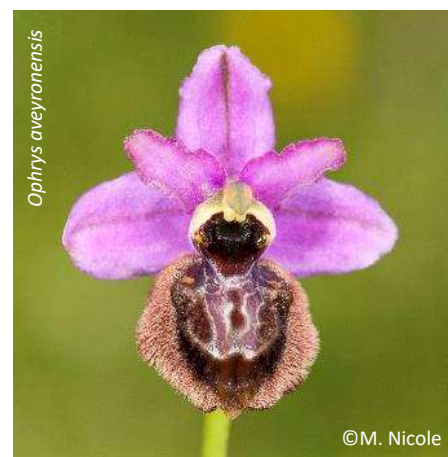
Ophrys aveyronensis Ophrys de l'Aveyron