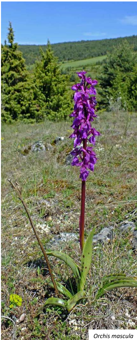
Orchis mascula Orchis mâle

Chercheur retraité de l'IRD en biologie végétale appliquée aux maladies des plantes. Adhérent à la SFO depuis 1994, il occupe un poste au sein du bureau de la SFO en région Languedoc depuis 2002, en tant que président d'abord, puis en tant que secrétaire. Cartographe de l'Hérault et cartographe régional pour le Languedoc, il est coauteur de deux taxons. Il est membre du conseil d'administration de la SFO.