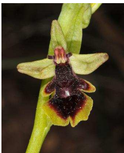
Ophrys subinsectifera France métropolitaine ( Ophrys presque mouche). Un des taxons récemment découvert en pays Catalan.

Cet ouvrage, destiné au grand public et aux passionnés de nature, présente une synthèse des connaissances sur les orchidées sauvages en Languedoc et Pays Catalan, territoire particulièrement réputé pour ses orchidées : au printemps, des amateurs viennent de toute l'Europe pour découvrir ces joyaux de notre flore sauvage.