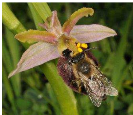
Pollinisation d' Ophrys Exaltata subsp. marzuola par une abeille, ©R.Buscaill