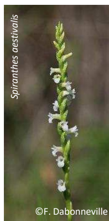
Spiranthes aestivalis Spiranthe d'été